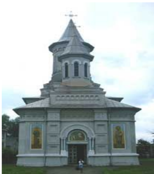
Foto 1. Biserica Sf. Gheorghe din or. Ocnița

Nu țin minte să fi fost în raionul nostru ceva acțiuni majore pentru apărarea culturii române... În provincie nu prea ajung bani pentru a încălzi școlile și spitalele în timpul rece al anului, iar despre ocrotirea culturii române nici nu merge vorba. Monumentul lui Constantin Stamat, de exemplu, n-a fost reparat, paremi-se, de când îi el.