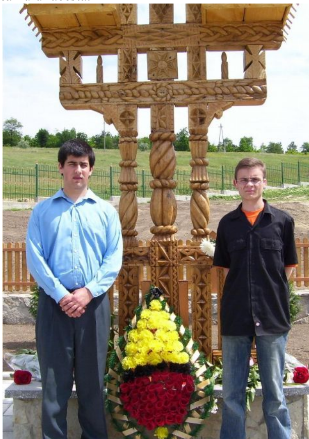
Delegația Noii Depte din Basarabia la ceremonia de sfințire a cimitirului militar de la Țiganca (iunie 2006).

Gândul legionar, în curățenia și puterea lui de pătrundere, a știut a distinge necesarul de întâmplător, adevărul de minciună, eternul de efemer. Gândul legionar a știut a distinge lumina de întuneric și viața de moarte. În acest fel Mișcarea Legionară, distingând elementele și respectând legile, clădește o lume românească nouă, după nevoile vremii și firea neamului acesta.