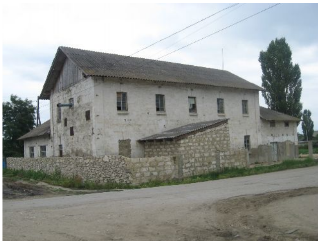
Foto 1. Moara Veche. A fost proprietatea mitropolitului Gurie Grosul

Ștefan cel Mare, către un boier oarecare. Apoi, pe moșie a apărut sătucul numit acum Ruseștii Vechi, care a trecut în posesia mai multor boieri, unul dintre ei fiind de origine rusă, sau avea numele de familie Rusu, iată de la acesta, a provenit și numele de Rusești. Însă legendele sunt legende, trecând din vorbă în vorbă, poate au mai suferit schimbări, și totuși, după cum bine știm, orice mit are un sâmbure de adevăr, care conferă credibilitate.