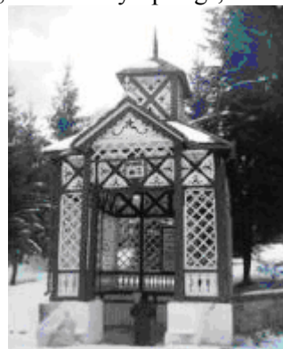
Izvoarul de apă minerală №3 sau Boldizsár

În ultimii ani produsele Romaqua Group au primit diferite premii internaționale, care le confirmă calitatea deosebită. În 2002 firma a primit, la Moscova, premiul pentru cea mai bună apă naturală plată, în 2003, la Bruxelles apa minerală plată de la Borsec a fost din nou premiată, iar în 2004, Romaqua a primit premiul pentru cea mai bună apă minerală naturală carbogazoasă, la Berkeley Springs, în SUA.