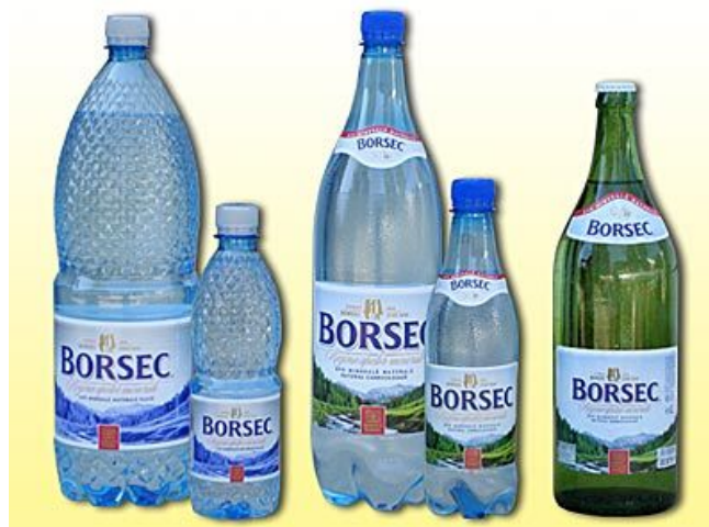
Produsele Romaqua Group S.A.- Borsec

Tradiția a fost continuată de către "Regina Apelor Minerale Borsec S.A", iar în prezent de Romaqua Group S.A.- Borsec.