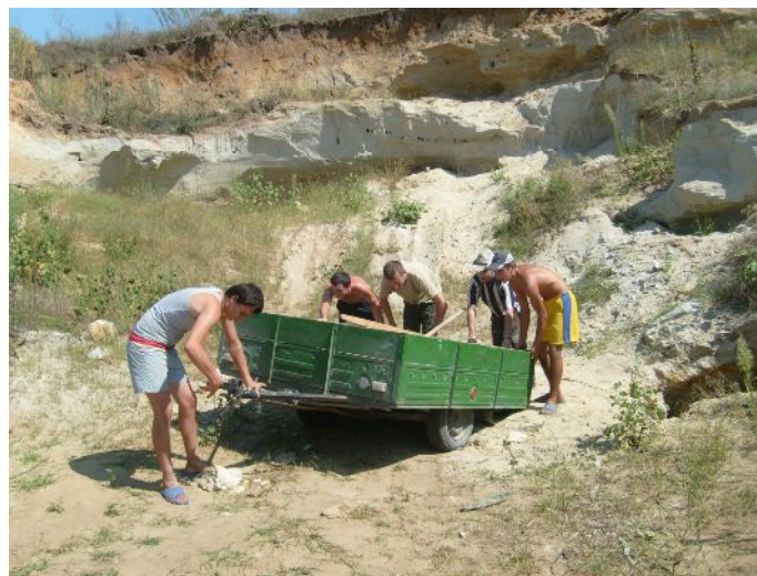
Noua Dreapta Basarabia la o tabără de muncă de la Călărași (august 2008).

O a treia caracteristică a stilului legionar este armonia. Viața legionară este clădită într-un desăvârșit echilibru de forțe și de elemente. Cugetul și fapta legionară se manifestă ca întreguri armonice, atât structura internă a elementelor ce o compun cât și dinamismul său creator nu depășesc cu nimic limita necesară. Nimic ce nu e mai mult sau mai puțin trebuie.